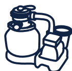
Groupe de filtration YZAKI 8,3 m 3 /h